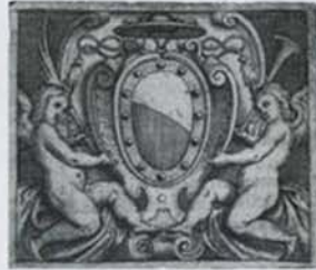
a cura di Roberto Borgia traduzione di Laura Di Lorenzo